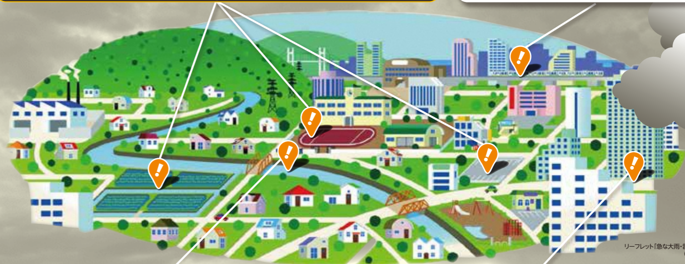
リーフレット「急な大雨・雷・竜巻から身を守る」(気象庁)を加工して作成